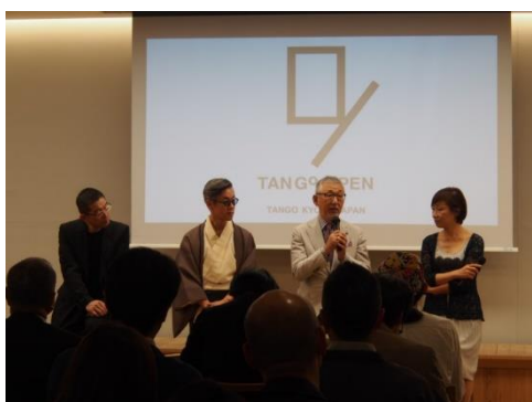
ゲストスピーカーを迎えてのトークショー