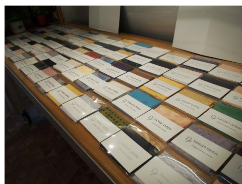
ノベルティのポケットチーフ