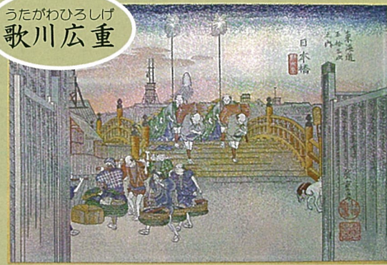
東海道五十三次(全55枚) 日本橋 とうかいどうごじゅうさんつぎ ぜん まい にほんばし

にし じん おり び じゅつ こう げい 西陣織美術工芸あさぎ ほん もの ~本物のものづくり~ せ かい ほこ しょく にん わざ らん くだ 世界に誇る職人の技をご覧下さい