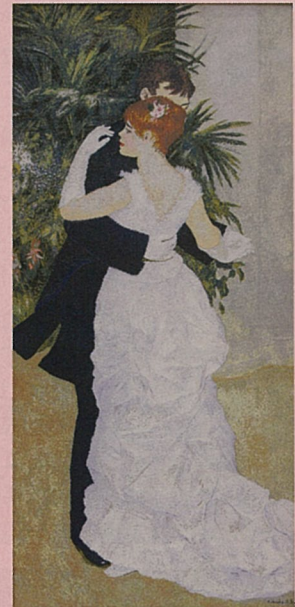
都会のダンス とがい