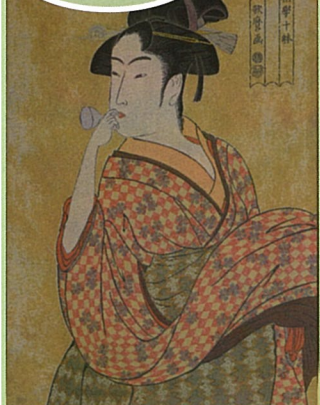
ポッピンを吹く娘 ふ むすめ