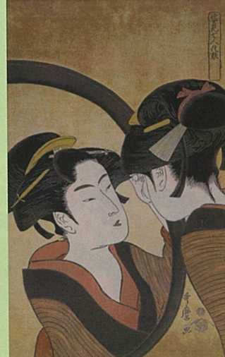
姿見七人化粧 すがたみななにんけしょう