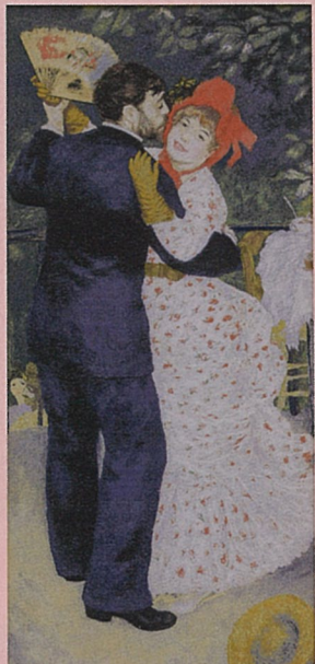
田舎のダンス いなか