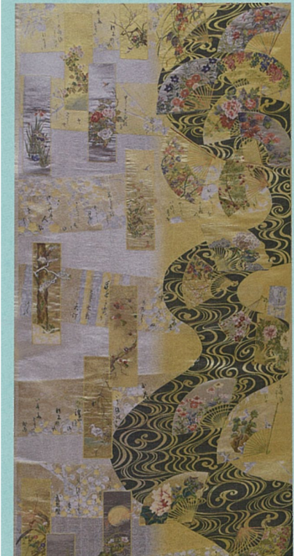
全通全景丸帯 琳派線乱 ぜんつうぜんけいまるおび りんぱりょうらん

せ かい さい こう きゅう 世界最高級で お しょく にん わざ 織り上げる職人技!