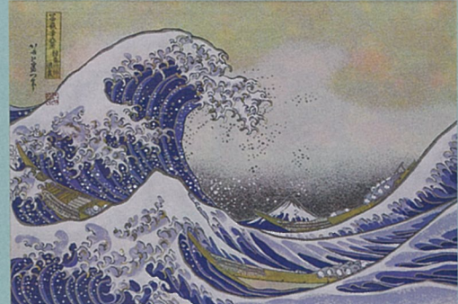
神奈川冲浪裏 かながわおきなみうら