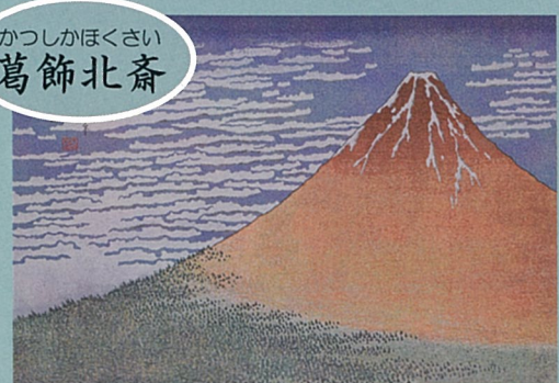
凱風快晴 がいふうかいせい