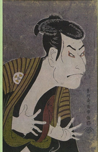
大谷鬼次 おおたにおにじ