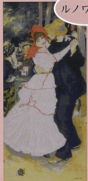
ブージュールのダンス