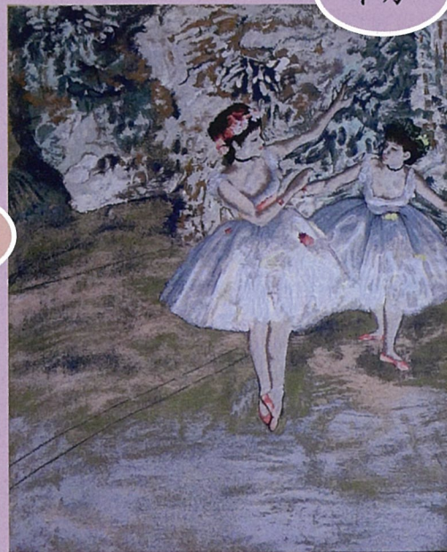
舞台の上の二人の踊り子 ぶたい うえ ふたり おど こ